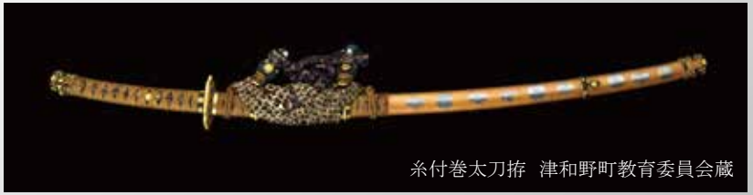
糸付巻大刀拵 津和野町教育委員会蔵