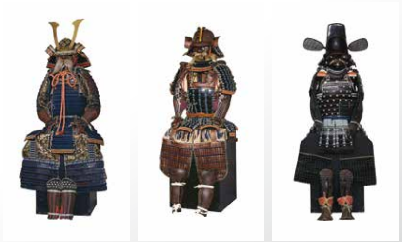
1.紺糸威二枚胴具足 2.藍韋素懸威最上胴具足 3.黒漆塗桶側菱綴二枚胴具足

今回の展覧会では、石見地方が誇る石州刀や歴史文化的に貴重な刀剣のほか、山口県岩国市・柏原美術館所蔵の貴重な甲冑も紹介いたします。