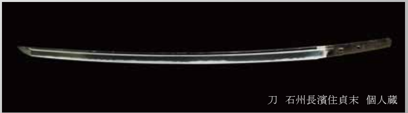
刀 石州長濱住貞末 個人蔵